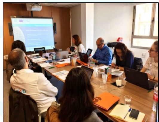
Η εναρκτήρια συνάντηση του έργου GLOBAL-SPIN με όλους τους εταίρους στη Granada (Ισπανία, 3/3/2017)