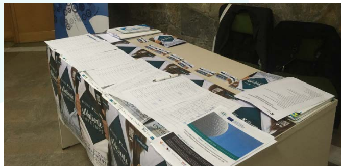
Διάδοση του ενημερωτικού υλικού για το GLOBAL-SPIN σε ένα workshop για επιχειρηματίες στο Πανεπιστήμιο της Granada