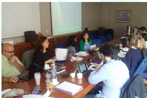
Socios de GLOBAL-SPIN participando en el segundo encuentro del consorcio en la Universidad de Patras, 20 de Septiembre de 2018