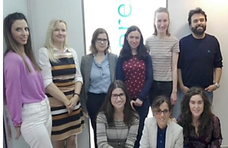
Η συνάντηση των εταίρων του GLOBAL-SPIN στο Παλέρμο, στις 12 Απριλίου του 2018.

Πολλαπλασιαστών καθώς και η δημιουργία του Μανιφέστο . Η συνάντηση ήταν μια καλή ευκαιρία για όλους τους εταίρους να επιβεβαιώσουν την πρόοδο τους στα επιμέρους έργα και να επιλύσουν οποιαδήποτε ερωτήματα και ζητήματα προέκυψαν